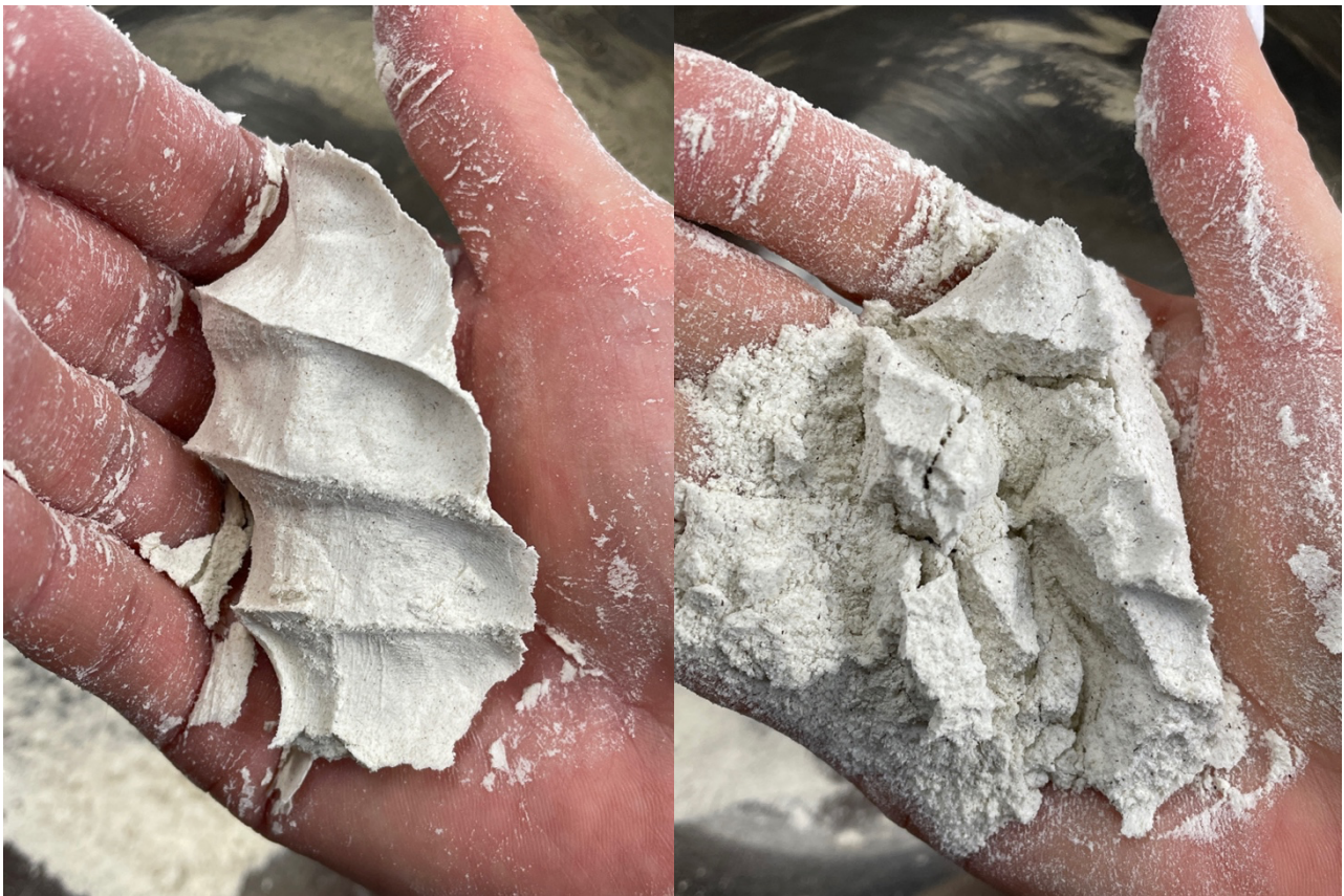
Foto di sebelah kiri menunjukkan tepung Soba yang dikisar halus untuk mengeluarkan sifat melekit, manakala foto di sebelah kanan menunjukkan tepung soba yang dikisar kasar.

Sebab cap jari kekal jelas dan membentuk jisim apabila anda membuka tangan selepas menggenggam tepung soba adalah kerana saiz butirannya halus (60~80 mesh), dan bahagian tepung # 2 dari tepung # 1 adalah kukuh dikisar halus, mewujudkan rasa melekit pada tepung itu sendiri. Jalur saiz bijian hampir tetap, dan ia adalah tepung soba yang stabil dan lembap.