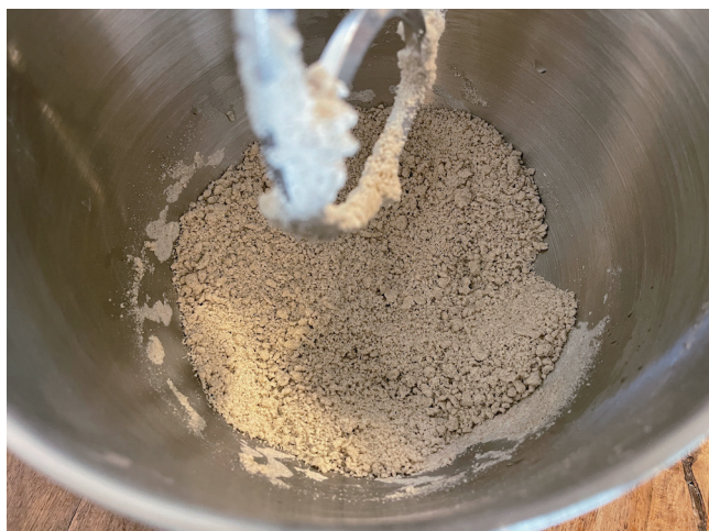
3. Umedecimento (Liquidificador/Espátula/Bater)