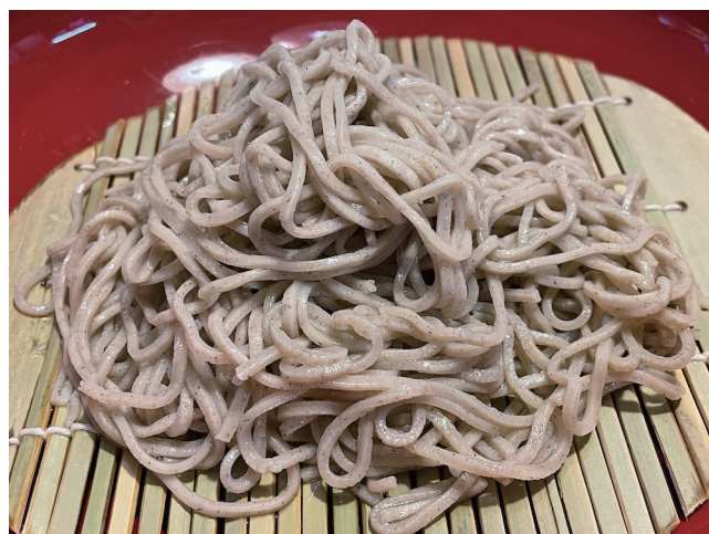
8. Zaru Soba - 100% macarrão de trigo sarraceno