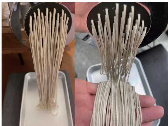
5. Macarrão Extrudado