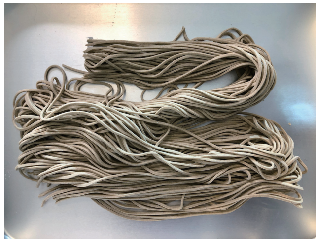
6. 100% macarrão de trigo sarraceno (macarrão fresco)