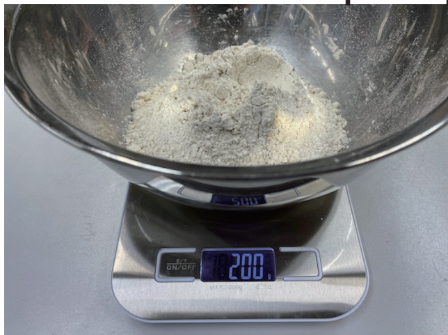
1. Medição de Farinha de Trigo Sarraceno