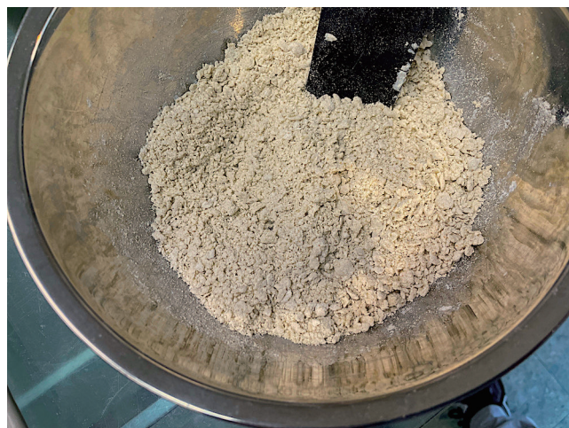
4. Coloque-o em um funil (sem endurecimento)