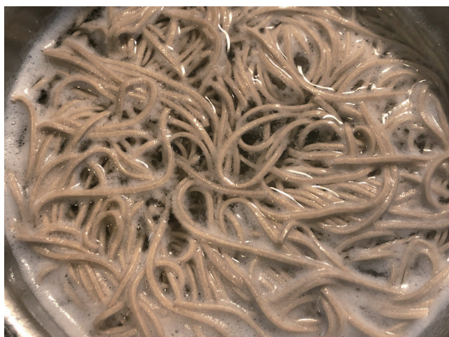
7. Ferver/Lavar/Apertar com Água Fria